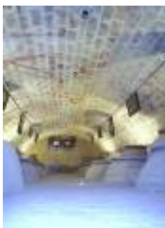
Imágenes de la exposición en la Bodega.