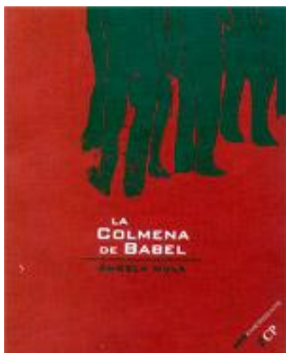
Catálogo de la exposición.