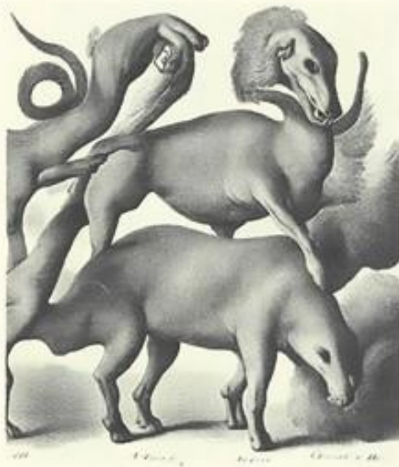
Pablo Sandoval. "Naturalezas insólitas" Fotografía digital sobre papel invertido sobre balda Medidas variables. 2022