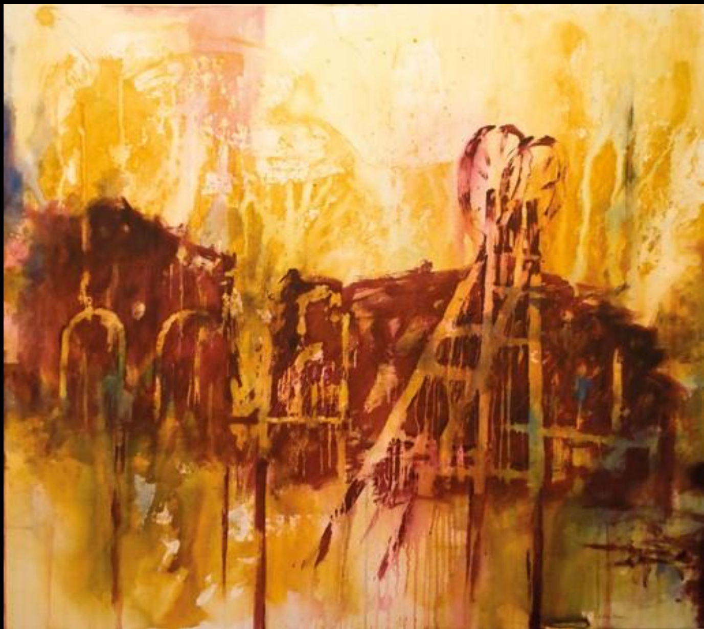
Esteban Bernal. "Paisaje Minero"