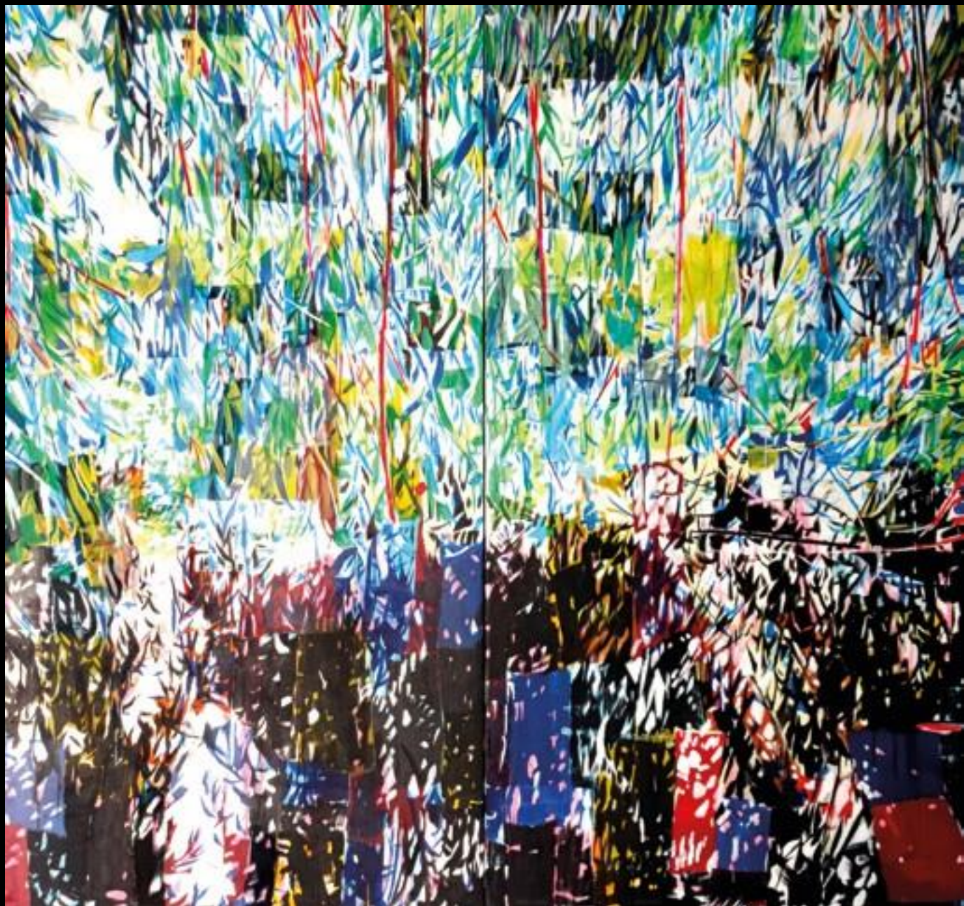
Manuel Pérez. "Reflejos" Acrílico/lienzo 215 x 230 cms. 2023