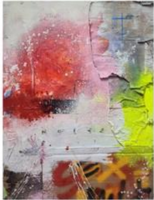
Omar Daf. "Nakedness of Need" Técnica mixta/cartón 100 x 70 cms. cada uno. 2023