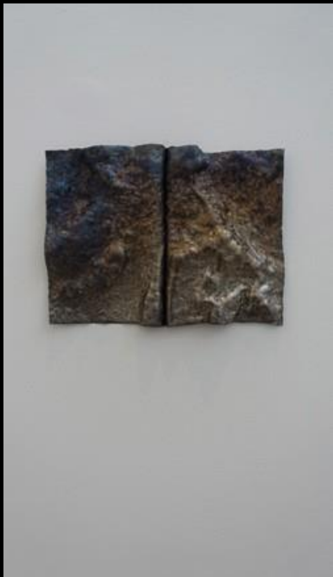
Cristóbal Barbero. “Libro” Tierra y plomo 50 x 33 x 7 cms. cada una