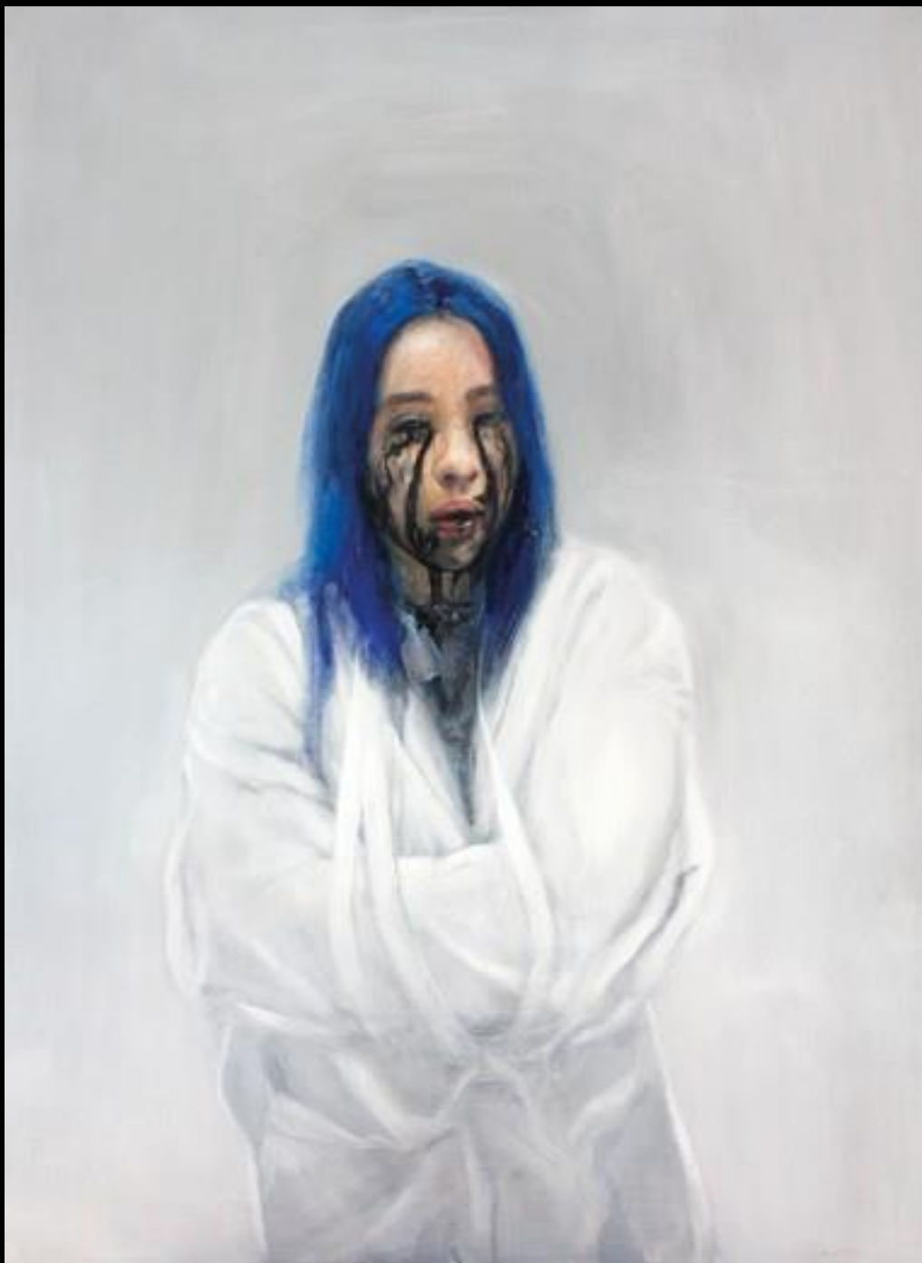
Lucas Brox. “Lágrimas negras” Óleo sobre tabla. 122 x 89 cms.